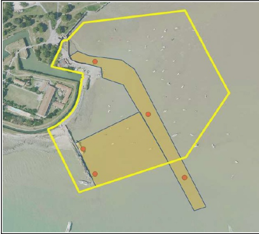
Zone de dragage autorisée dans le port de l'Île d'Aix (en orange)