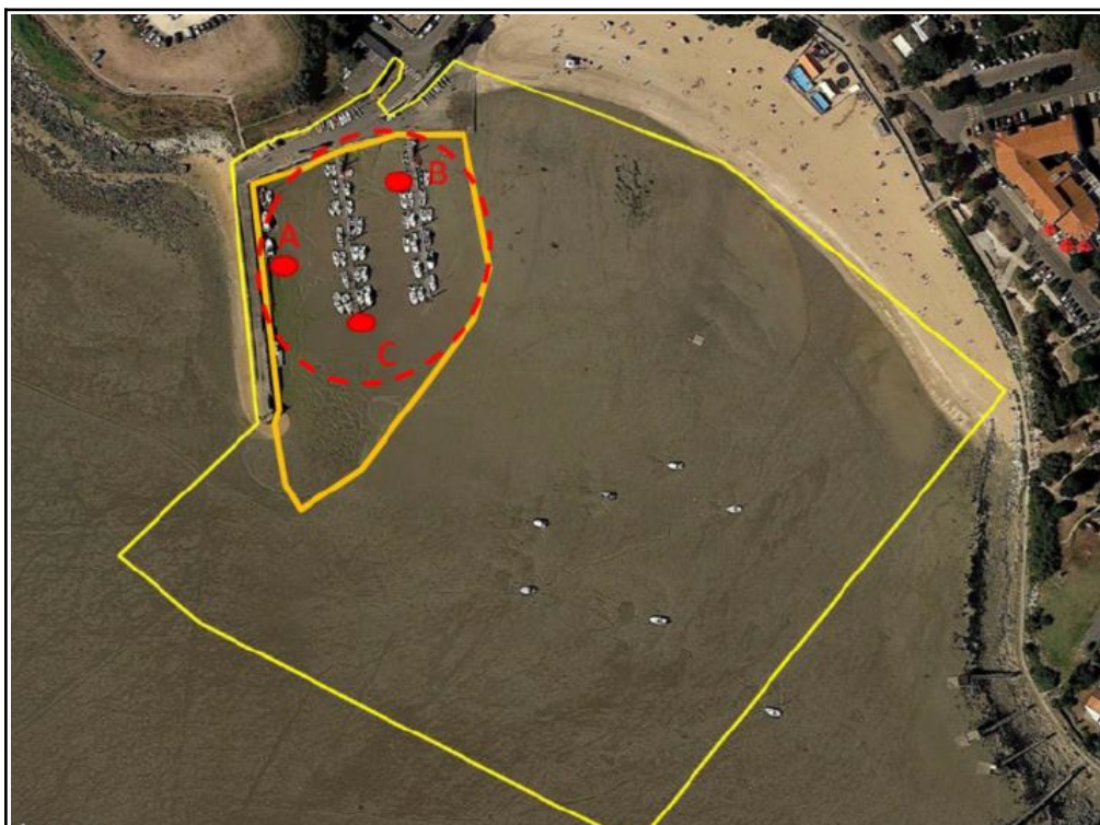
Plan d'échantillonnage dans le port de Fouras Sud