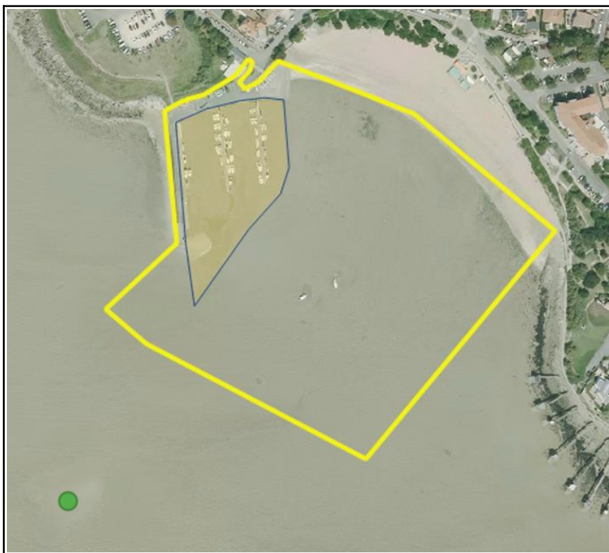
Zone de dragage autorisée dans le port de Fouras Sud (en orange) et point de rejet de la drague aspiratrice stationnaire (en vert)