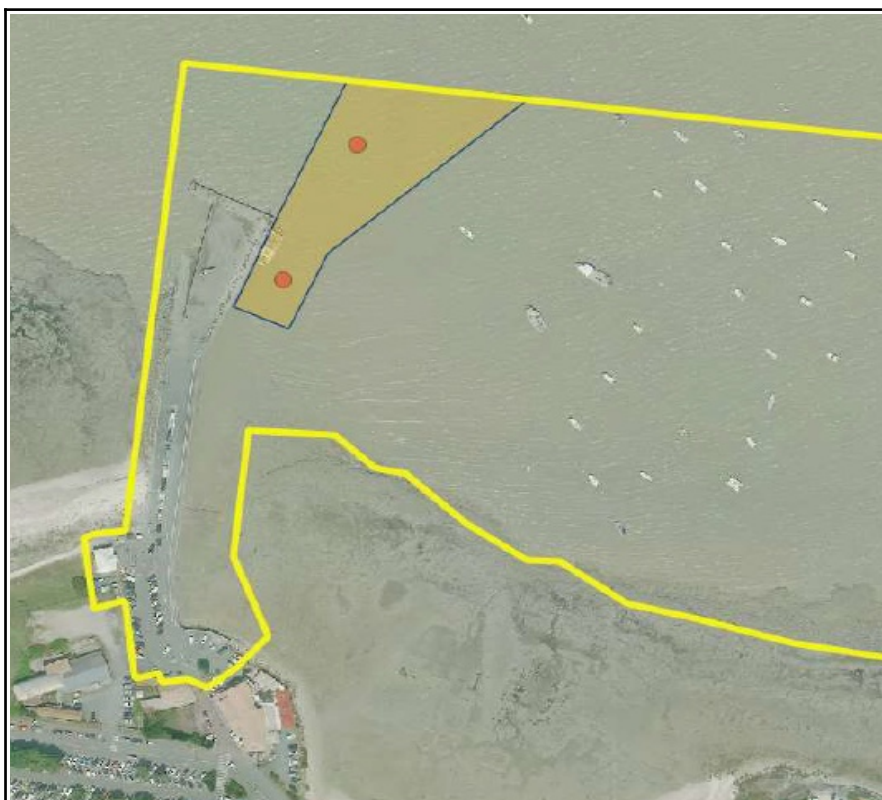
Zone de dragage autorisée dans le port de la Fumée (en orange)