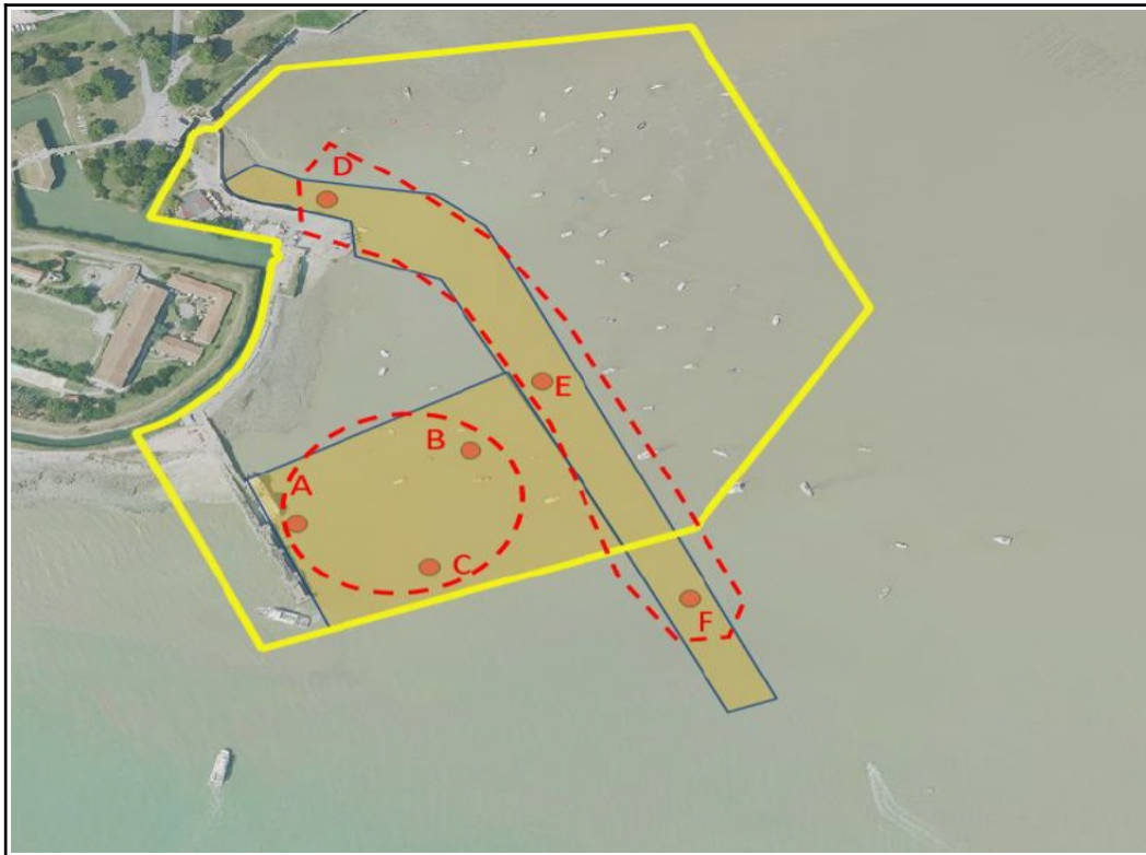
Plan d'échantillonnage dans le port de l'Île d'Aix